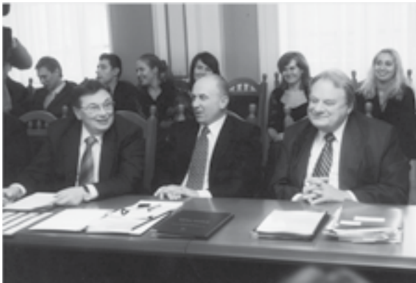
Засновник Дипломатичної академії Геннадій Удовенко — член вченої ради ДАУ

після закінчення навчання дійшов до посади Генерального консула України в Москві. Василь Кирилич після вчителювання на Львівщині, закінчивши академію, досягнув дипломатичної вершини — став Надзвичайним і Повноважним Послом України в Хорватії. Засіявши це поле на замовлення МЗС і зібравши відповідний щедрий врожай, який ми йому передали, академія чекала на чергові планові системні