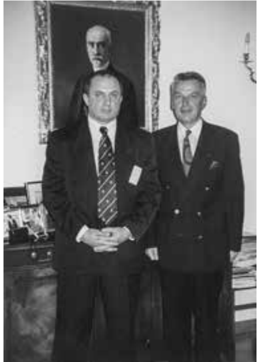
Започаткування співпраці з Віденською дипломатичною академією. В кабінеті її ректора Пауля Ляйфера, 1997 рік

Не можу не сказати і про те, що відкриття Дипломатичної академії, перші кроки її діяльності викликали неабиякий резонанс не тільки у вузькому дипломатично-експертному середовищі, а й, не побоююсь сказати, у загальнонаціональному масштабі. До нового навчального закладу виявляли такий інтерес, що майже раз-двічі на місяць я давав інтерв'ю провідним газетам і журналам, виступав у прямому ефірі на радіо- та телеканалах. Чисельні публікації були також і на обласному рівні, велику цікавість виявили до нового навчального закладу громадяни АР Крим, інших регіонів України. Ми впевнено йшли вперед, і нашу тверду ходу в майбутнє підтримувало ще й те, що за недалеким обрієм ми вже бачили власне приміщення, власну матеріально-технічну базу, й не абиде (наприклад, на Татарці, розглядався й такий варіант, були міркування