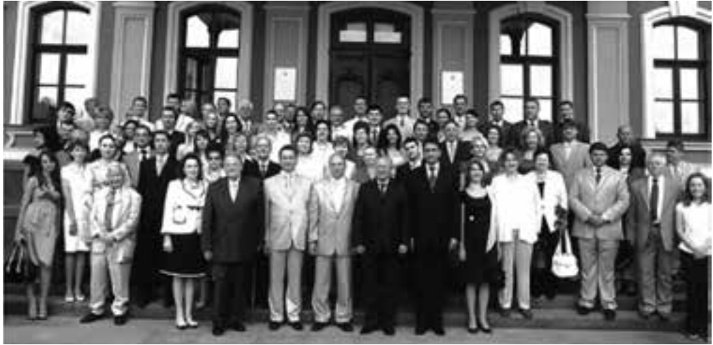
Випуск 2008 року