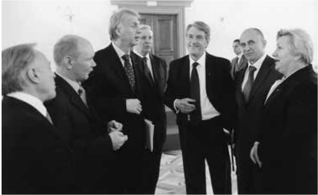
Дипломатична академія України за часів міністра Володимира Огризка

Diplomatic Academy of Ukraine during Volodymyr Ohryzko's time as Minister for Foreign Affairs