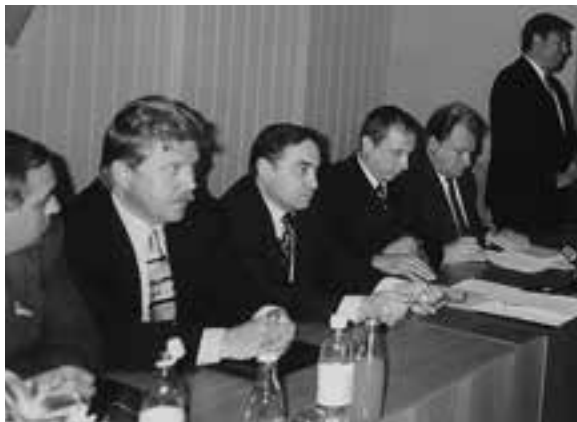
2 вересня 1996 р. Дипломатична академія розпочала свою діяльність

Отже, 2 вересня 1996 року академія відчинила свої двері (1 вересня була неділя). Святкові збори, приурочені врученню посвідчень слухача ДА її першому набору, відвідали Міністр закордонних справ Г.Й. Удовенко, його заступник В.Д. Хандогій, депутати Верховної Ради України, відповідальні співробітники Кабінету Міністрів України тощо. Корабель спустили на воду, і сприятливий вітер