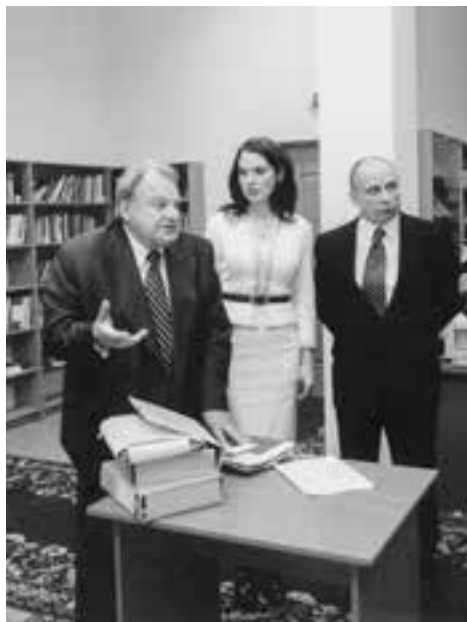
Передавання до бібліотеки ДАУ архіву Геннадія Удовенка

Transfer of Hennadii Udovenko's archive to the library of the Diplomatic Academy of Ukraine