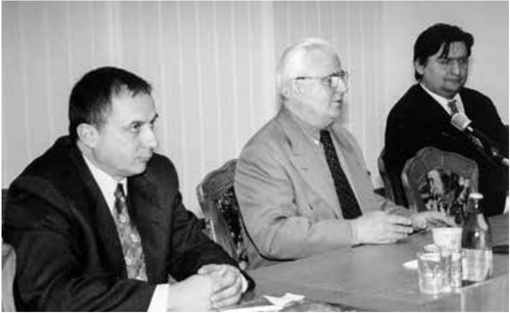
Виступ у Дипломатичній академії Президента України Леоніда Кравчука

President of Ukraine Leonid Kravchuk delivering a speech at the Diplomatic Academy