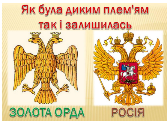
Ілюстрація – Leonid Shershun

Земля та всі засоби виробництва також ставали власністю московських правителів. Майже повністю такий устрій зберігся аж до ліквідації кріпацтва у другій половині ХІХ століття. Якщо в Європі на вищих щаблях стоїть «nobility», тобто аристократія, а за нашими традиціями – шляхта та утверджується система васалітету, то в Московії до верхів належать лише придворні люди царя, дворянство, зокрема і вся царська обслуга – від «постельнічих», «стольнічих» до «конюших».