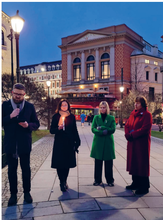
Вшанування пам'яті жертв Голодомору (Осло)

ми спостерігаємо, як процедури та рішення, які зазвичай забирали кілька місяців, реалізують за кілька днів. Одним із найкритичніших завдань цього періоду було поглибити взаємодію з Норвегією в питаннях зміцнення стійкості й обороноздатності України, зокрема й збільшення постачання необхідної зброї та затвердження п'ятирічного пакета підтримки України на суму понад 7 млрд євро. Крім того, за цей час вдалося переконати Норвегію приєднатися до основної групи зі створення спеціального трибуналу, до танкової коаліції, реалізації Формули миру, ініціативи «Зерно з України», а також визнати Голодомор геноцидом на місцевому та регіональному рівнях тощо.