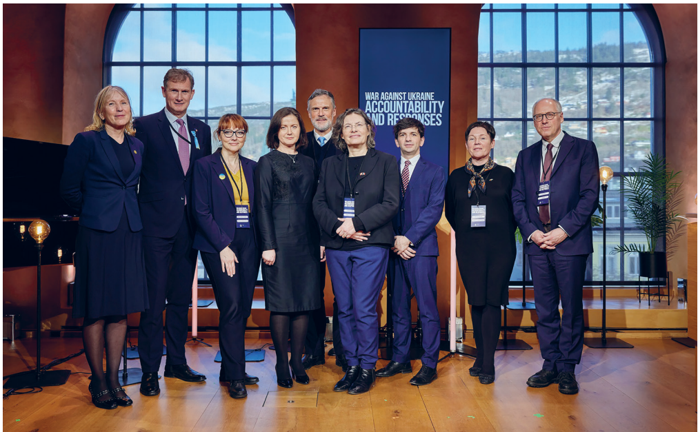
Посли іноземних країн у Норвегії під час вшанування річниці повномасштабної війни росії проти України

Ambassadors of foreign countries to Norway commemorating the anniversary of russia's full-scale war against Ukraine