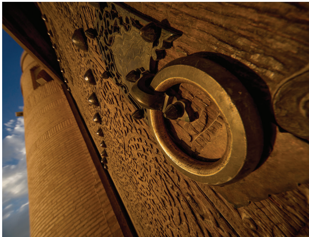
У передчутті східної казки In the premonition of the oriental fairy tale

Унікальні пам'ятки давнини, багатство і різноманітність природи, вікові традиції ремісництва, мудрі звичаї та народні свята зосереджені в історичних містах Самарканд, Хіва, Бухара, Шахрисабз, Ташкент та інших.